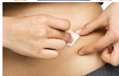
Limpie con movimientos circulares.

Limpie el sitio a inyectar con una toallita o algodón con alcohol. Deje secar. Limpie con movimientos circulares.