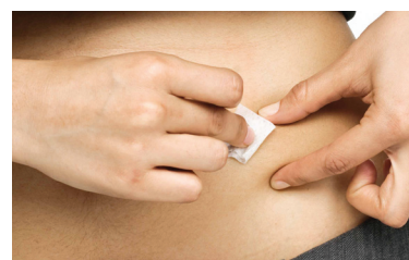
Limpie con movimientos circulares.